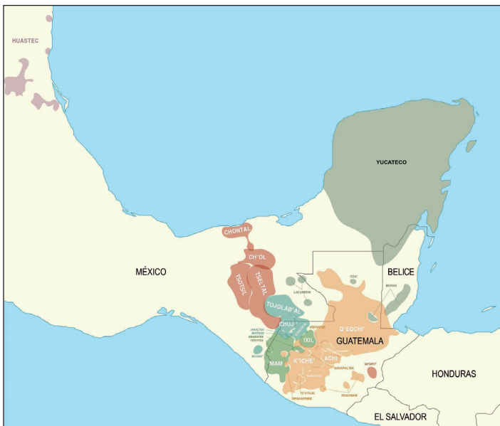
Mapa de los idiomas Mayas (Royer, 2022a: 12).